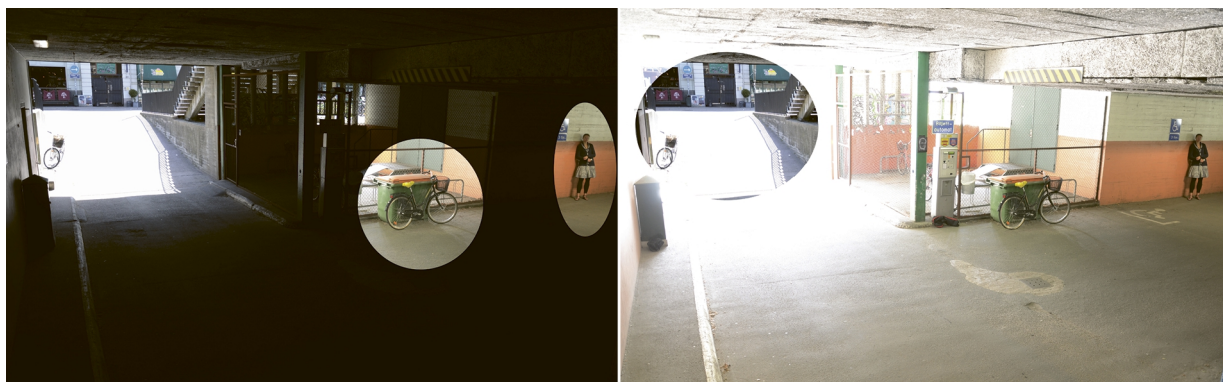
Figure 2. Die gleiche Szene wie zuvor. Im linken Bild die Details, die bei kurzer Belichtungszeit nicht erkannt wurden. Im rechten Bild die Details, die bei langer Belichtungszeit nicht erkannt wurden.

Bei den folgenden Bildern wurden Teile des kurz belichteten Bildes in das lange belichtete Bild eingefügt und umgekehrt. Es wird deutlich, dass die Kamera ohne WDR wichtige Objekte in der Szene nicht erkannt hat.