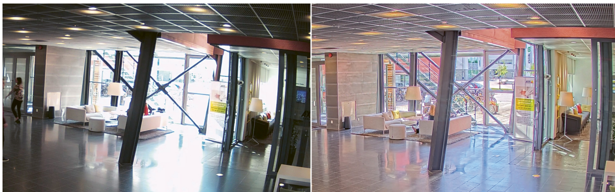
Figure 3. Innenraumszene mit starker Hintergrundbeleuchtung. Vergleich zwischen einer Kamera ohne WDR-Funktion (links) und einer Axis-Kamera mit Forensic WDR (rechts).

Die folgende Abbildung vergleicht die Aufzeichnung einer Szene von zwei verschiedenen Kameras: links mit einer Kamera ohne WDR-Funktion, rechts mit einer Axis-Kamera mit Forensic WDR. Mit Forensic WDR sind die Details sowohl im von hinten beleuchteten Innenraum als auch im Außenbereich deutlich sichtbar.