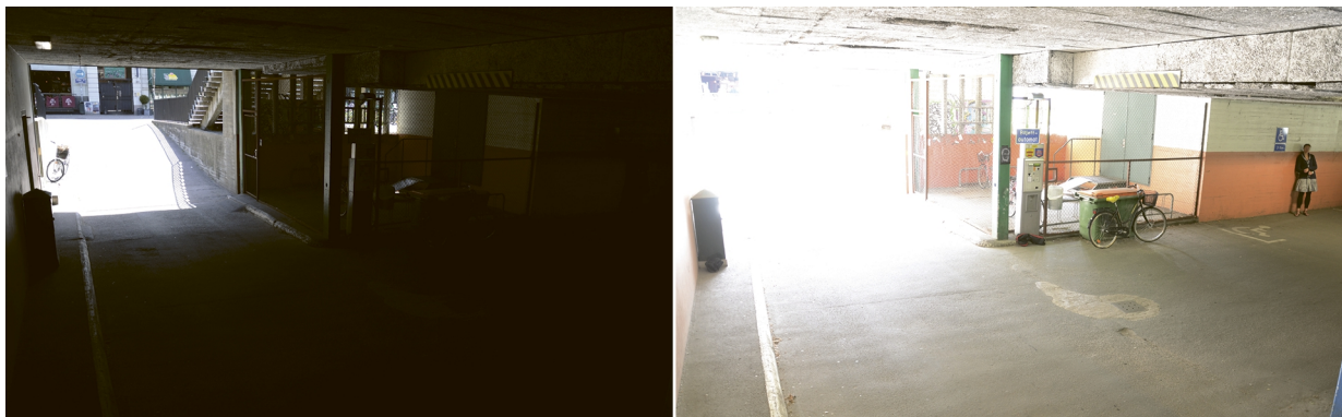
Figure 1. Eine typische Überwachungsszene mit großem Dynamikbereich: ein Parkhaus mit heller Einfahrt. Die beiden Abbildungen wurden mit unterschiedlich langer Beleuchtung aufgenommen: das linke mit kürzerer und das rechte mit längerer Belichtungszeit.

Die folgende Beispielszene mit großem Dynamikbereich wurde mit einer Sicherheitskamera ohne WDR erfasst.