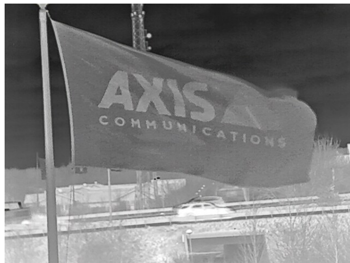
Sichtstörung durch eine Fahne.

Wärmebildkameras mit Unterstützung für elektronische Bildstabilisierung werden weniger durch Vibrationen beeinflusst. Diese Faktoren sollten bei der Installation einer Wärmebildkamera aber trotzdem berücksichtigt werden, um die Kameraleistung zu optimieren.