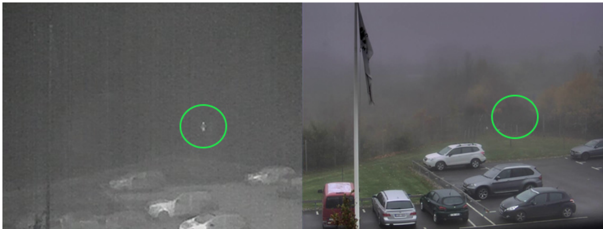
Bilder einer Wärmebildkamera (links) und einer visuellen Kamera (rechts) an einem nebligen Tag. Eine Person (in der Kreismarkierung) ist mit der Wärmebildkamera zu erkennen, nicht aber mit der visuellen Kamera.

Axis Wärmebildkameras arbeiten hauptsächlich im langwelligen Infrarotbereich (LWIR). LWIR-Wellenlängen werden unter Bedingungen mit Schwebstoffteilchen in der Luft wie Nebel und Rauch generell besser übertragen als die Wellenlängen von sichtbarem Licht. Die „kurzen“ Wellenlängen des sichtbaren Lichts werden in den meisten Fällen von den Partikeln stärker absorbiert und gestreut als die LWIR-Wellenlängen. Das verkürzt die Erfassungsreichweite visueller Kameras im Vergleich zu Wärmebildkameras. Eine Person, die bei Nebel mit einer Wärmebildkamera deutlich zu sehen ist, kann für eine visuelle Kamera unsichtbar sein.