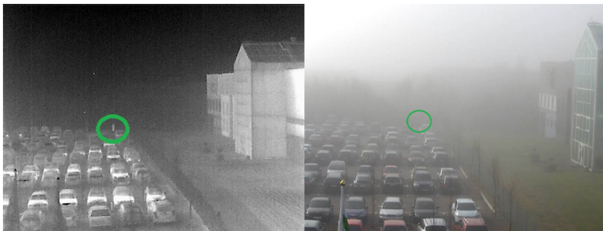
Bilder einer Wärmebildkamera (links) und einer visuellen Kamera (rechts) an einem nebligen Tag. Eine Person (Kreismarkierung) kann mit der Wärmebildkamera gesehen werden, nicht aber mit der visuellen Kamera.

einer visuellen und einer Wärmebildkamera. Die Erfassungsreichweite einer Wärmebildkamera wird in der Regel weniger durch das Wetter (z. B. Nebel) beeinträchtigt als bei einer visuellen Kamera.