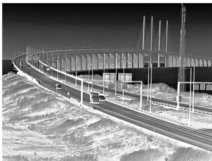
Scharfer Kontrast im Hintergrund an einem sonnigen Tag.

An einem wolkigen Tag wäre der Hintergrundkontrast geringer, an einem sonnigen Tag höher. Die Temperaturunterschiede verstärken sich, weil sich die Oberflächen von Gegenständen aus unterschiedlichem Material unterschiedlich schnell aufheizen.