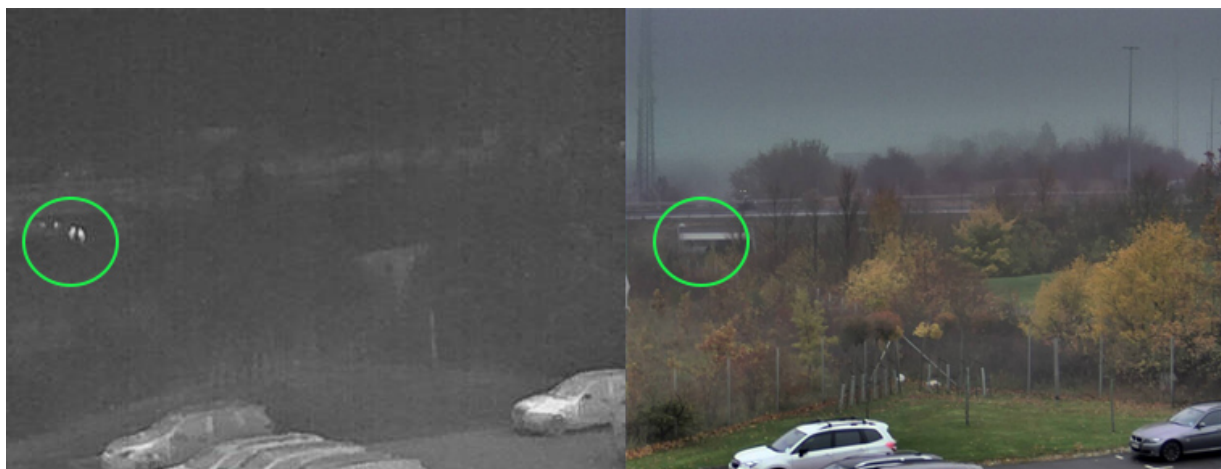
Bilder einer Wärmebildkamera (links) und einer visuellen Kamera (rechts) an einem regnerischen Tag. Die Personen (in der Kreismarkierung) sind mit der Wärmebildkamera leicht zu erkennen.

Personen trotzdem einfacher erkennen, weil der Kontrast zwischen der warmen Person und dem kalten Hintergrund größer sein wird.