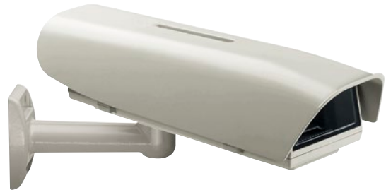
HOV + WBOVA2

Für die unterschiedlichen Anforderungen in verschiedenen Einsatzbereiche stehen zahlreiche Optionen wie Heizung, Lüftung und Filter, sowie Kamera-Netzteile und Scheibenwischer zur Verfügung.