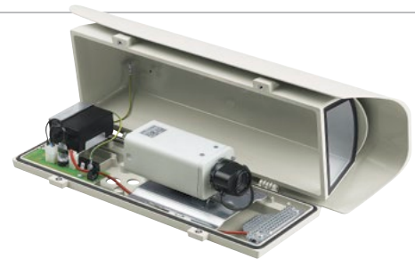
HOV + KAMERA