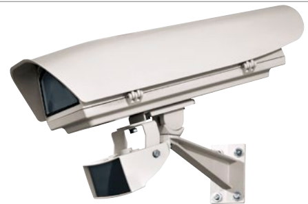
HOV + OSUPPIR + GEKO IRH + WBJA