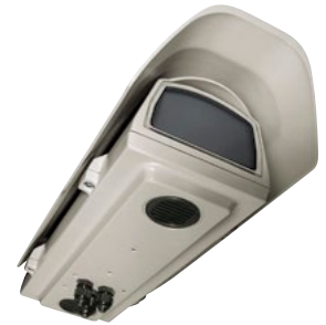
HOV + MIT KÜHLSYSTEM